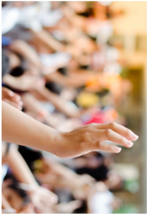
Des appels sont notamment relayés sur le site www.ollni.be

La participation citoyenne est au cœur de notre programme. Depuis 2019, cinq rencontres dans les quartiers ont été organisées sous l'appellation « Dialoguez avec le Collège ». Un panel citoyen a également été mis sur pied dans le cadre du Schéma d'Orientation Local (SOL) de la zone de L'Esplanade, et d'autres panels ont été constitués pour co-créer le Programme d'Actions Mobilité (PAM). Avec vous la prochaine fois ?