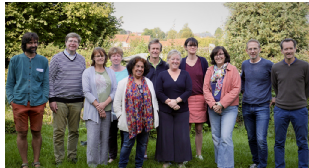
Sept conseiller·ères communales et quatre conseiller·ères CPAS mettent une partie de leur temps et de leur énergie au service des citoyennes et du projet politique d'Ecolo.