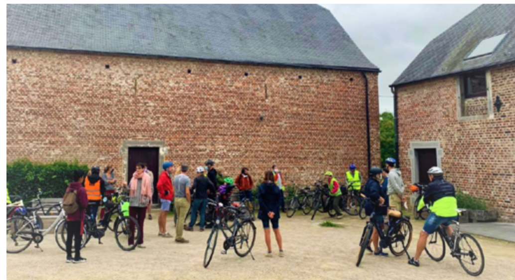
A la découverte du patrimoine de notre commune (Vert Pop – Août 2020). La participation des membres est essentielle pour le projet politique écologiste et la dynamique collective. N'hésitez pas à nous rejoindre!

Depuis 2019, la co-présidence insiste pour que chacun puisse s'exprimer et se sentir écouté. En effet, les réunions, ça peut rapidement tourner en cacophonie! Des moments en sous-groupes ainsi que des tours de tables sont proposés et le timing des interventions est tenu à l'oeil. En dehors des réunions mensuelles, des groupes de travail ont été mis en place : un groupe travaille sur la mobilité, un autre est axé sur la gestion des déchets et un troisième sur les questions liées au genre. Des conférences et débats sont organisés.