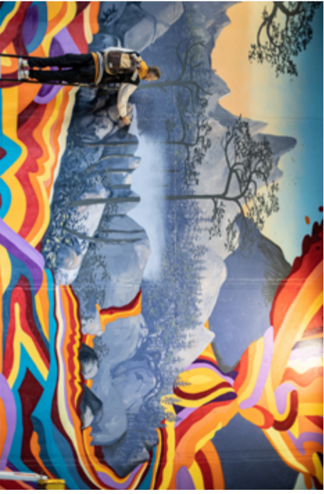
Le collectif Farm Prod au travail – Photo: François Boujou

La crise COVID a été un réel frein pour la vie culturelle. Néanmoins, la Ville a soutenu les acteurs culturels par des aides directes mais également par le maintien d'événements tels que « Place aux artistes » et « Fresh Paint ».